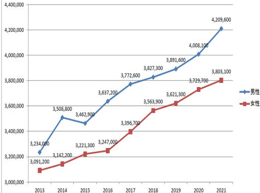
保育士の平均年収の推移(男女別)